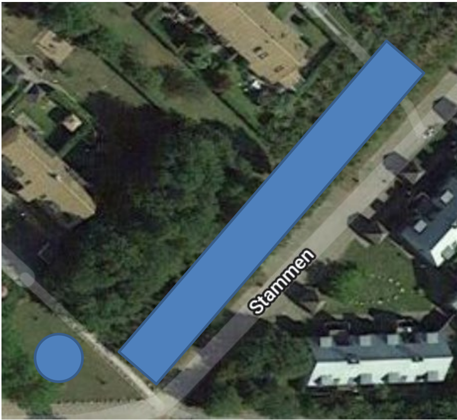
Slutningen af stammen. Vildt græs mellem æbletræerne.