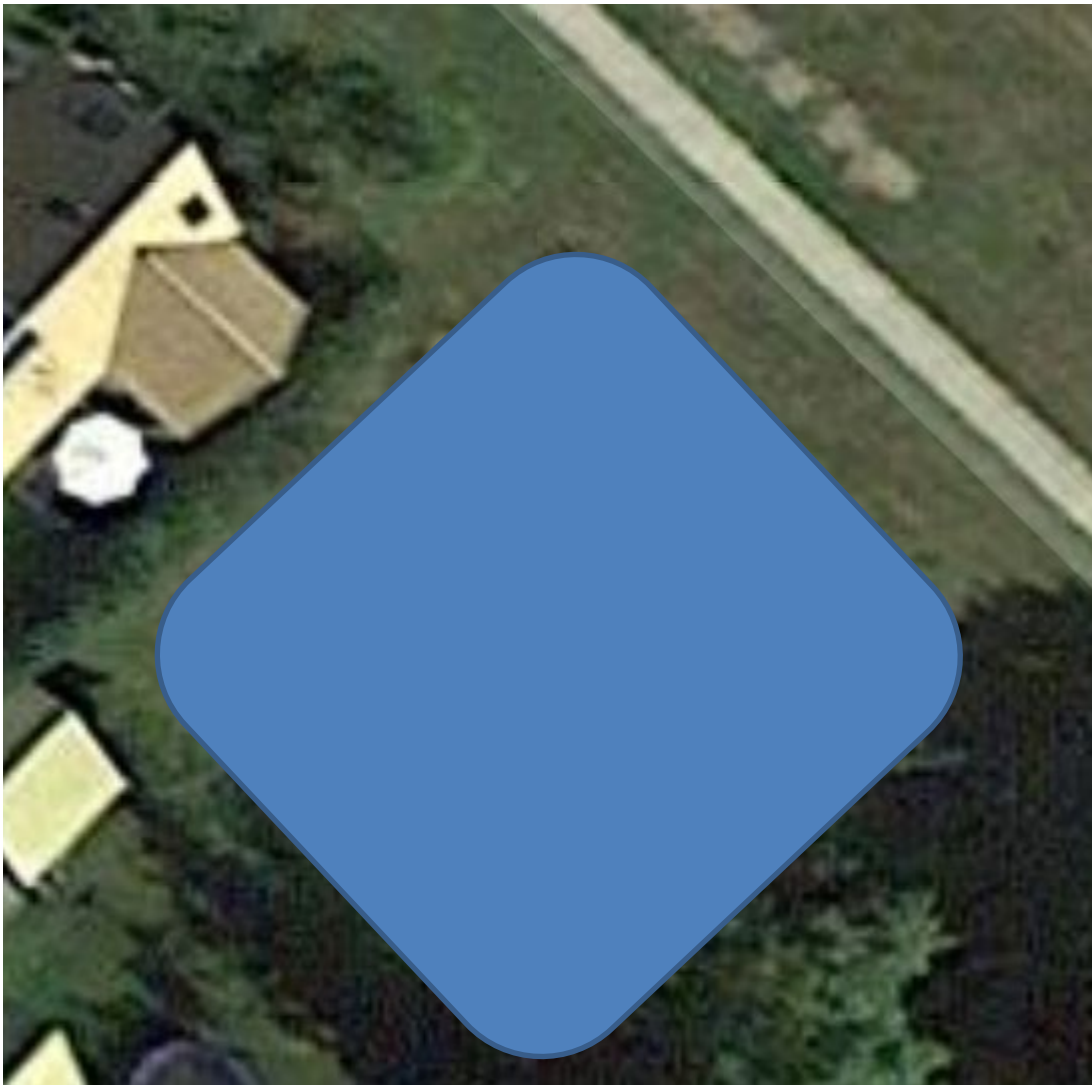
Græsareal ved nyplantede æbletræer vokser vildt.